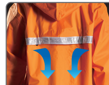
プリズムタイプ 反射帯付(背中)+ベンチレーション