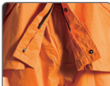
上下両開き ファスナー