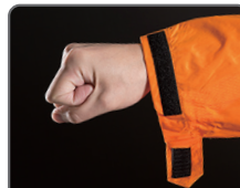
袖口半ゴム 半ベルト調節