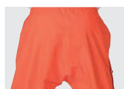
シームレスパンツ