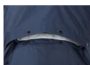
バックベンチレーション

背中だけでなく、胸にもベンチレーションを設けることで、通常時にも積極的に換気することができます。