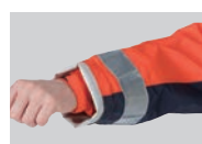
調整機能の内袖付