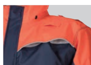
チェストベンチレーション

背中だけでなく、胸にもベンチレーションを設けることで、通常時にも積極的に換気することができます。