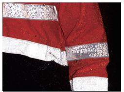
高輝度反射材使用