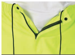
パンツ前開きタイプ