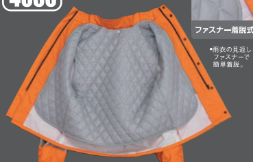
ファスナー一括脱着