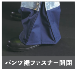
パンツ裾ファスナー開閉