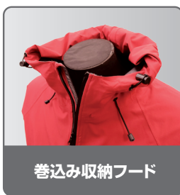
巻込み収納フード