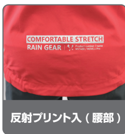
反射プリント入 (腰部)