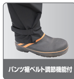
パンツ裾ベルト調節機能付