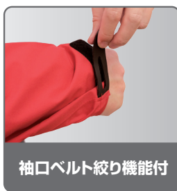
袖口ベルト絞り機能付