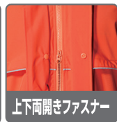
上下両開きファスナー

少しファスナーを開ければ、着座時に裾が膨らんで作業の邪魔をすることがないストレスフリー設計。ウエストポーチ等を装着時にも下から開けられるので重宝します。