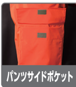
パンツサイドポケット

少しファスナーを開ければ、着座時に裾が膨らんで作業の邪魔をすることがないストレスフリー設計。ウエストポーチ等を装着時にも下から開けられるので重宝します。