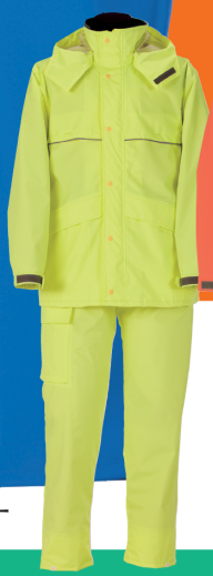
フラッシュイエロー