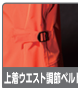
上着ウエスト調節ベルト