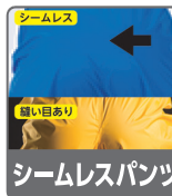
シームレスパンツ

内部からの圧力や着座時の圧力が最もかかる部分に縫目を作らないことで浸水のリスクを回避。