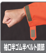
袖口半ゴム半ベルト調節

矢印のように左右から水が流れてきてもファスナー部から浸水しないように表側へ2重カバー。